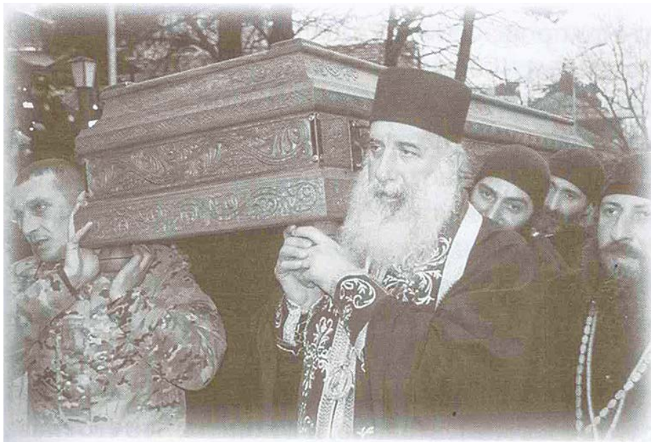
Крестный ход с мощами преподобного Гавриила

«Перед Богом все грехи как камушки. В мире нет такого греха, который превосходил бы милосердие Божие...»