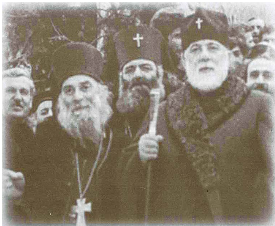
Отец Гавриил с Католикосом-Патриархом всея Грузии Илиёй II

В его келье люди менялись неузнаваемо. Однажды отец Гавриил сказал своему духовному сыну архимандриту