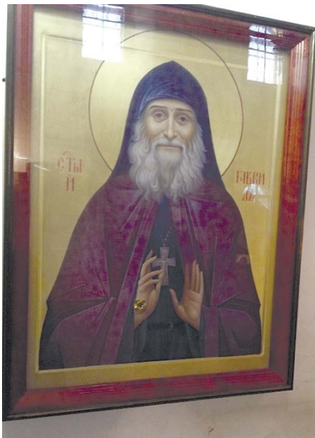
Икона Гавриила (Ургебадзе), находящаяся в п. Клин Куньинского района

После всеобщего бдения накануне величайшего праздника Хитона Господня и Столпа мироточивого отец Гавриил остался в церкви, умоляя Господа о помощи и спасении от епитимьи, чтобы удостоиться принять Божественное При-