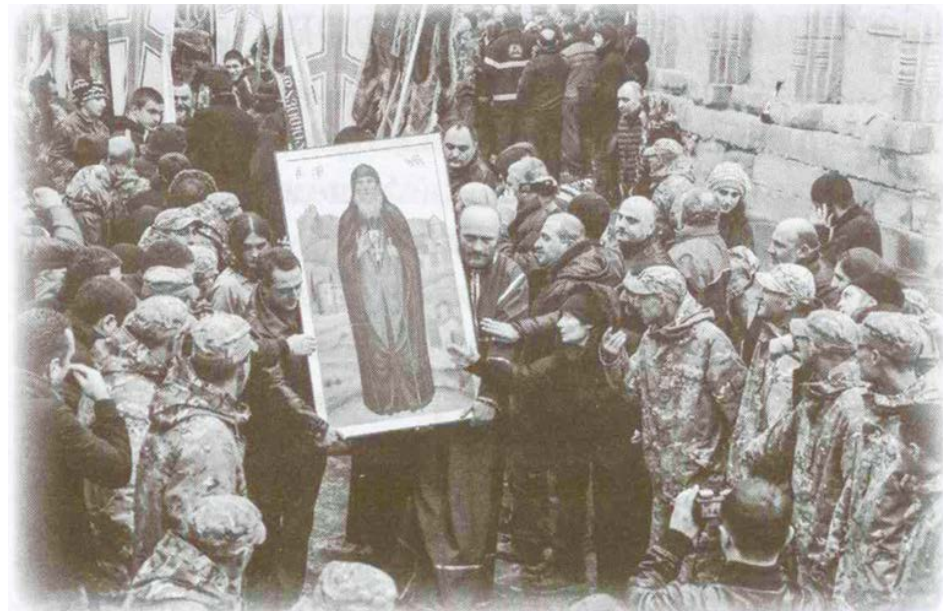
В день обретения мощей преподобного Гавриила

Преподобноисповедник». М. Изд. Сретенского монастыря, 2018 г.)