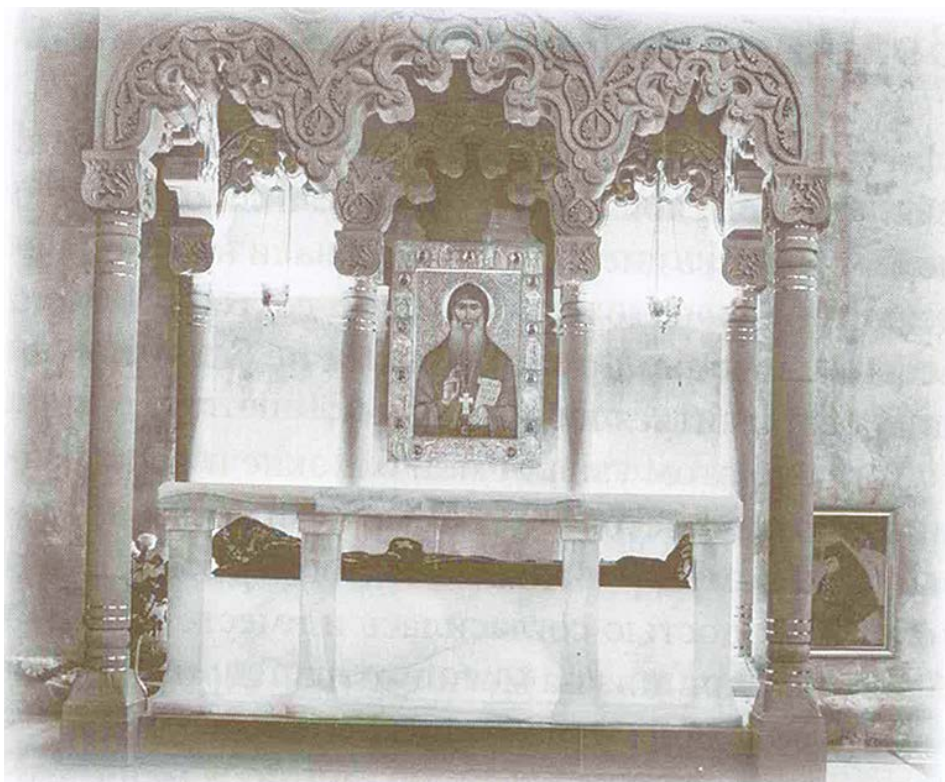
Рака с мощами преподобного Гавриила

20 декабря 2012 года Священный Синод Грузинской Православной Церкви причислил архимандрита Гавриила (Ургебадзе) к лику святых как преподобноисповедника и юродивого. Память его