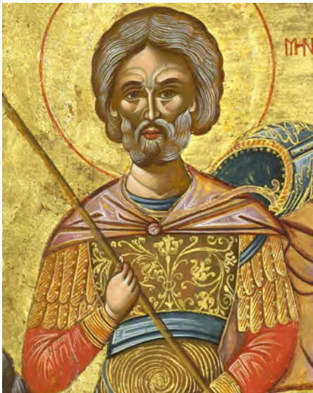
Великомученик Мина Египетский