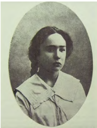
В год поступления в Петербургскую консерваторию. 1912 год

изменно идти по пути духовных созерцаний, собирать себя для просветления, которое придет однажды. В этом смысл моей жизни. Я - звено в цепи искусства».